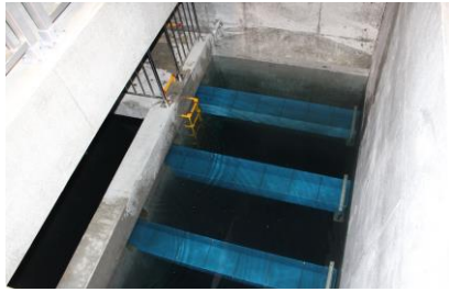
当別浄水場活性炭ろ過池