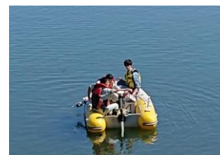
水質調査（ダム貯水池）

水源の水質状況を把握するため、ダム貯水池及び上流河川において定期的に水質調査を実施するとともに、関係機関と水質に関する情報を共有するなど連携して水源の監視を行っていきます。