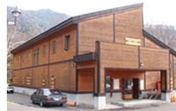
道民の森(宿泊施設)

水源である当別ダム上流には、道民の森に設置された宿泊施設やレクリエーション施設のほか、小規模な事業場が数軒点在していますが、水質汚濁の原因となる大きな発生源はなく、安全で良質な水道用水を供給することができる良好な状態であります。