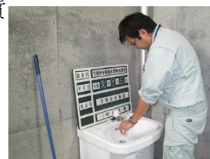
水質検査（試料採取）状況

なお、試料の採取及び運搬に当たっては、告示法（水質基準に関する省令の規定に基づき厚生労働大臣が定める方法）で定められた方法により行います。