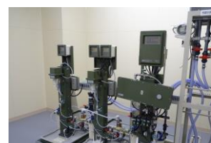
当別分水施設水質自動計器

原水、浄水及び分水について、水道法で月1回以上と定められている一般細菌、大腸菌、塩化物イオン、有機物（TOC）、pH、味、臭気、色度、濁度の9項目及びカビ臭の原因物質であるジェオスミン、2-メチルイソボルネオールなど、水質管理上注意すべき項目として14項目の検査を行います。