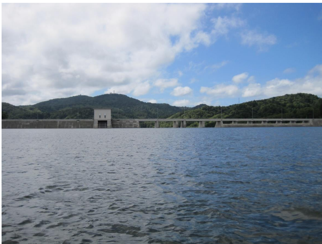
当別ふくろう湖から当別ダム堤体を望む