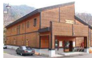
道民の森(宿泊施設)

水源である当別ダム上流には、道民の森に設置された宿泊施設やレクリエーション施設のほか、小規模な事業場が数軒点在していますが、水質汚濁の原因となる大きな発生源はなく、安全で良質な水道用水を供給することができる良好な状態であります。