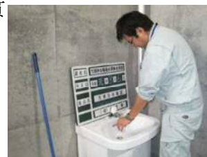
水質検査（試料採取）状況

なお、試料の採取及び運搬に当たっては、告示法（水質基準に関する省令の規定に基づき厚生労働大臣が定める方法）で定められた方法により行います。