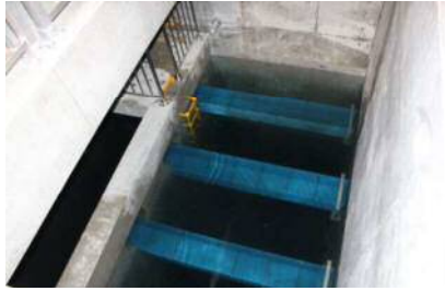
当別浄水場活性炭ろ過池