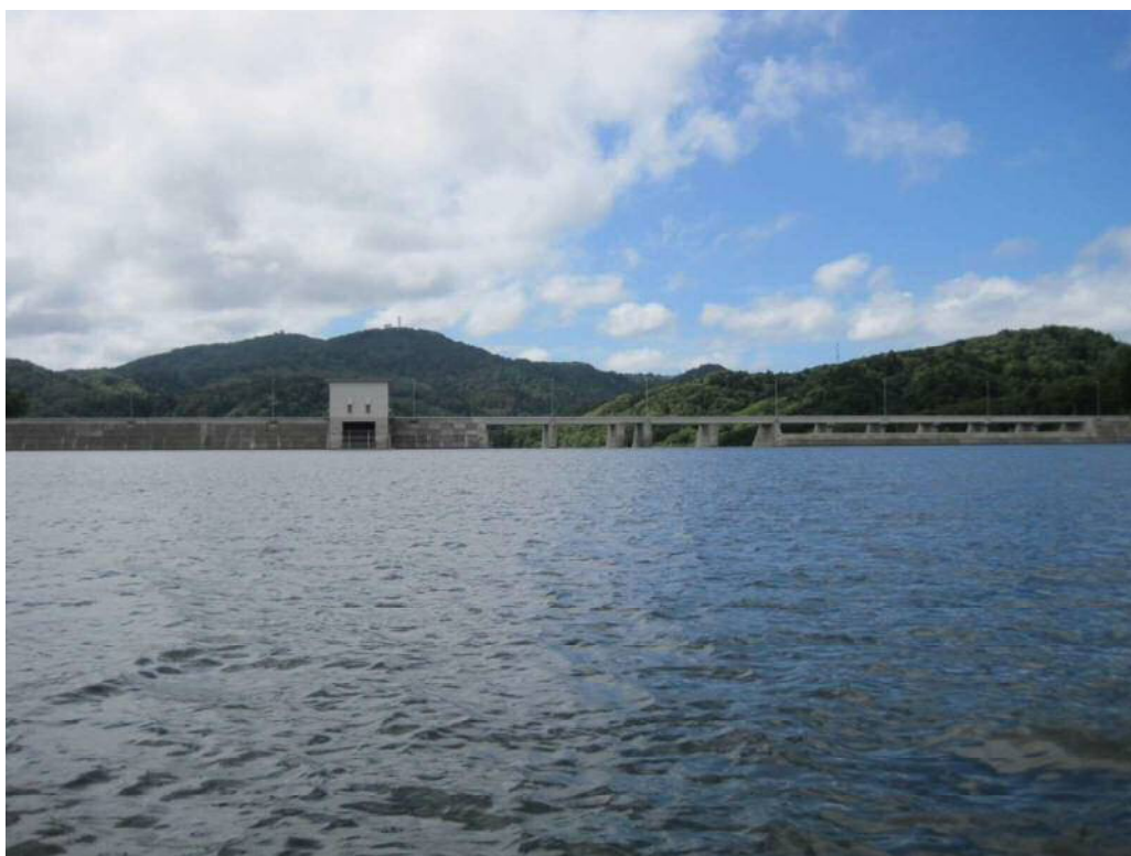
当別ふくろう湖から当別ダム堤体を望む