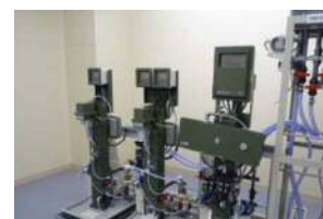
当別分水施設水質自動計器

原水、浄水及び分水について、水道法で月1回以上と定められている一般細菌、大腸菌、塩化物イオン、有機物（TOC）、pH、味、臭気、色度、濁度の9項目及びカビ臭の原因物質であるジェオスミン、2-メチルイソボルネオールなど、水質管理上注意すべき項目として14項目の検査を行います。