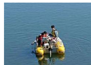
水質調査（ダム貯水池）

水源の水質状況を把握するため、ダム貯水池及び上流河川において定期的に水質調査を実施するとともに、関係機関と水質に関する情報を共有するなど連携して水源の監視を行っていきます。