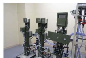
当別分水施設水質自動計器

原水、浄水及び分水について、水道法で月1回以上と定められている一般細菌、大腸菌、塩化物イオン、有機物（TOC）、pH、味、臭気、色度、濁度の9項目及びカビ臭の原因物質であるジェオスミン、2-メチルイソボルネオールなど、水質管理上注意すべき項目として14項目の検査を行います。