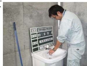
水質検査（試料採取）状況

なお、試料の採取及び運搬に当たっては、告示法（水質基準に関する省令の規定に基づき厚生労働大臣が定める方法）で定められた方法により行います。