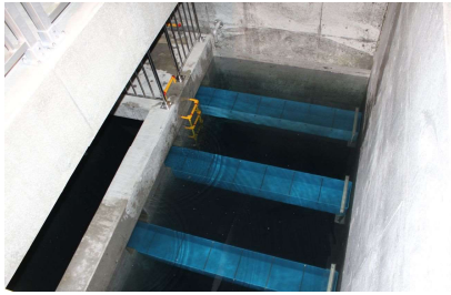
当別浄水場活性炭ろ過池