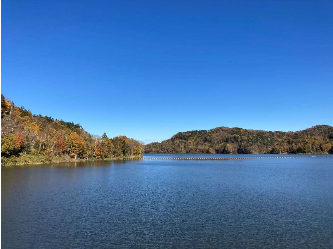
当別ダム堤体からふくろう湖を望む