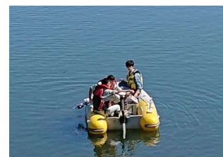
水質調査（ダム貯水池）

水源の水質状況を把握するため、ダム貯水池及び上流河川において定期的に水質調査を実施するとともに、関係機関と水質に関する情報を共有するなど連携して水源の監視を行っていきます。