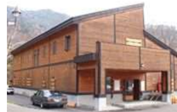
道民の森(宿泊施設)

水源である当別ダム上流には、道民の森に設置された宿泊施設やレクリエーション施設のほか、小規模な事業場が数軒点在していますが、水質汚濁の原因となる大きな発生源はなく、安全で良質な水道用水を供給することができる良好な状態です。